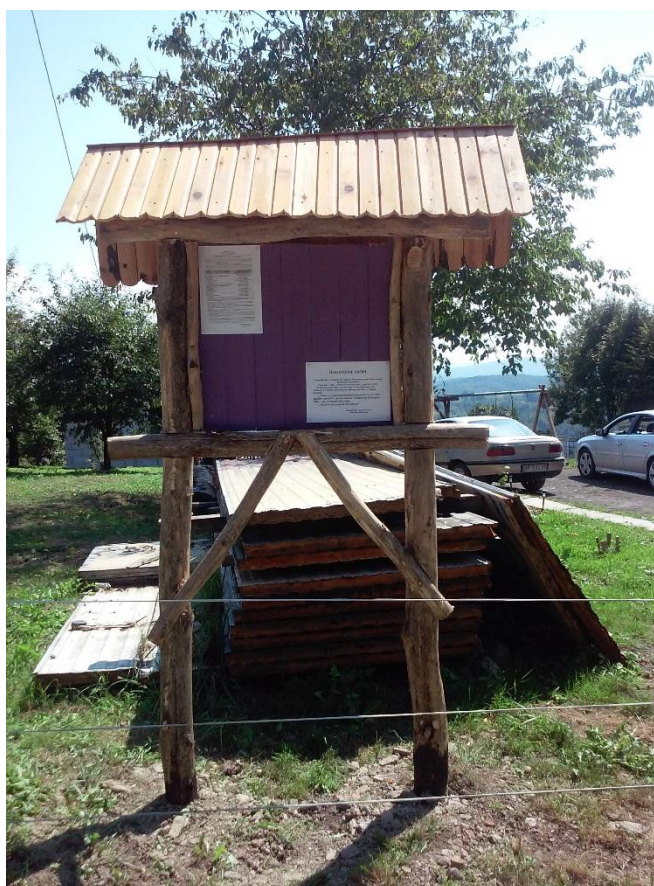
TAKIE O TO TABLICE OGŁOSZEŃ W CZYNIE SPOŁECZNYM POWSTAŁY W NASZEJ WSI