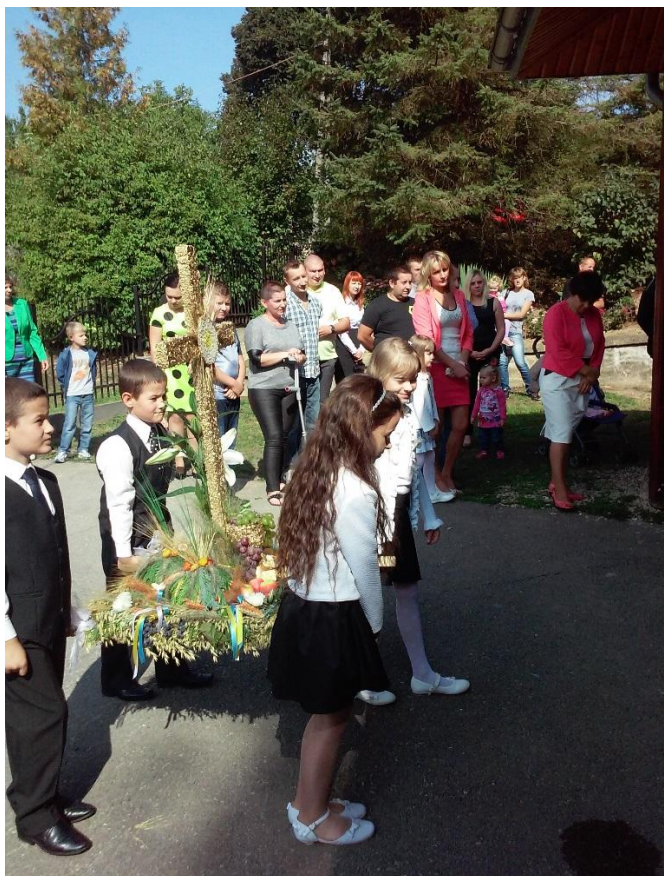
POŚWIĘCENIE WIEŃCA DOŻYNKOWEGO 09.2015r