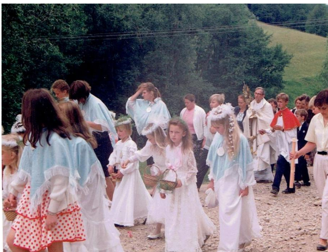
KOŚCIÓŁ WE WSI ZALESIE ORAZ PROCESJA BOŻEGO CIAŁA 1996r